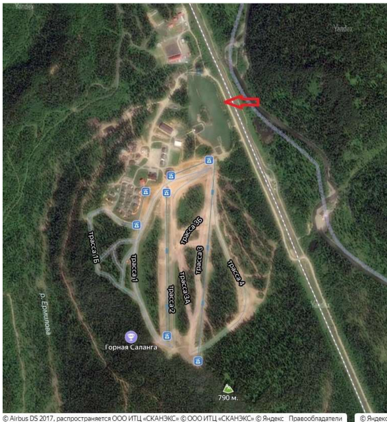
Рис. 4. Земельный участок с обозначением пруда (красный указатель) и реки Ермилова