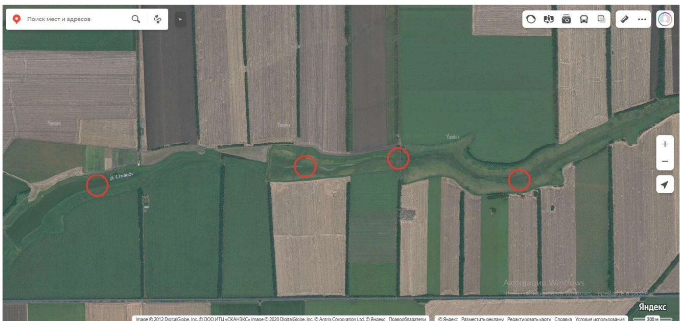
Рис. 2. Те же земельные участки (красные фигуры) с обозначением балки Ставок